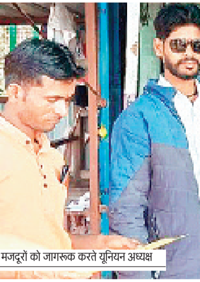
मजदूरों को जागरूक करते यूनियन अध्यक्ष