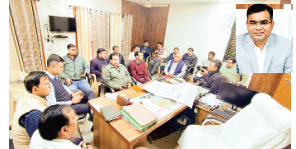
हरिभूमि न्यूज़ ललितपुर

जिलाधिकारी सत्य प्रकाश के निर्देशन में जिले में जनगणना-2027 सम्पादित की जानी है, जिसके लिए जिलाधिकारी ने जिला स्तरीय जनगणना समिति का गठन किया है, जिसमें जनपद, परगना एवं तहसील स्तर की जनगणना कार्य हेतु जिले के 15 अधिकारियों को नियुक्त किया है।