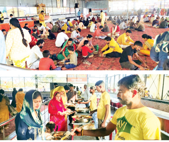
नलखेड़ा। माघ मास की गुप्त नवरात्रि के दौरान एक श्रद्धालु द्वारा सिद्धपीठ मां बगलामुखी मंदिर पर पीताम्बर सेवा समिति के मंडारा परिसर में बाहर से आने वाले श्रद्धालुओं के लिए निशुल्क मंडारा चलाया जा रहा है। जहां बड़ी संख्या में श्रद्धालु भोजन प्रसादी ग्रहण कर रहे हैं। गुप्त नवरात्रि के दौरान प्रतिदिन कन्या पूजन उपरत सुबह 11 बजे मंडारा प्रारंभ किया जा रहा है जोकि सायं 5 बजे तक चलता है। गौरतलब है कि वर्ष की चैत्र नवरात्रि व शारदीय नवरात्रि पर्व पर मां बगलामुखी मंदिर के समीप पीताम्बर सेवा समिति द्वारा निशुल्क मंडारा का आयोजन किया जाता है।