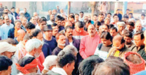
हरिभूमि न्यूज़ ललितपुर