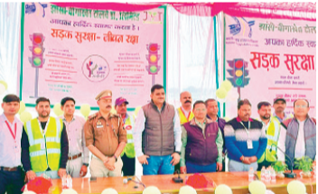
हरिभूमि न्यूज़ ललितपुर